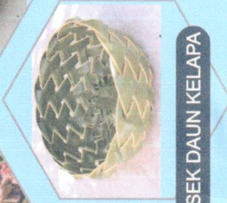
BESEK DAUN KELAPA